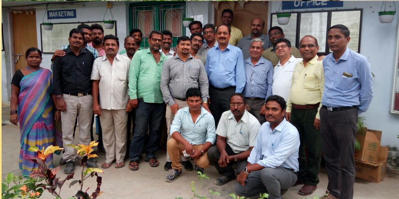
In the month of June 2017, The Industrial Packaging (IP) Plant at Chittoor achieved the highest ever dispatch of 1,72,938 barrels. Production numbers were 1,70,225. This is the highest ever production and dispatch of barrels by any IP Plant in a single month. The leadership team of SBU:IP visited the Chittoor Plant to congratulate the Southern Region IP Team.