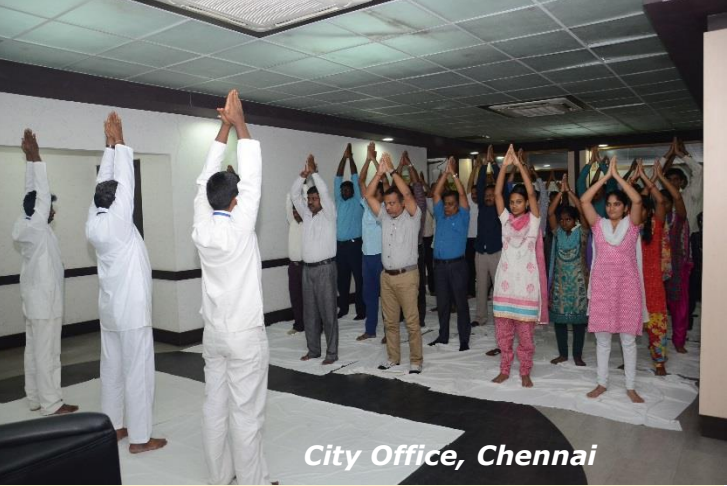
City Office, Chennai