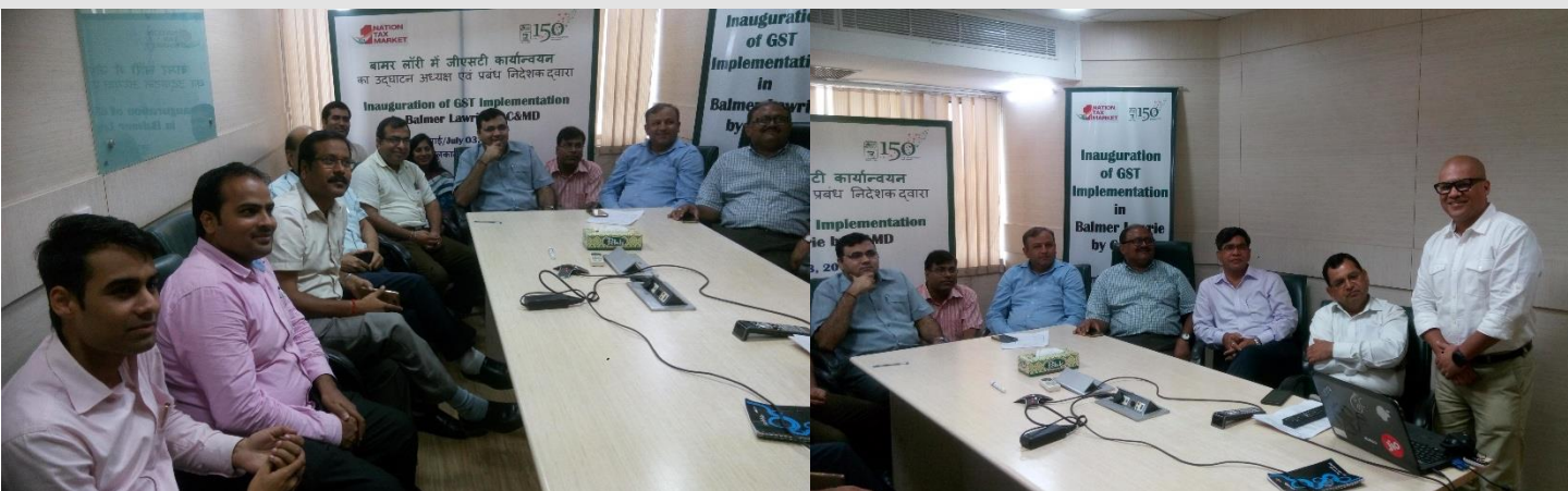
A knowledge sharing and Q&A session on 'Druva in Sync Back Up' was held for employees in Delhi on 3 rd July 2017 at the Scope Complex Office in New Delhi.