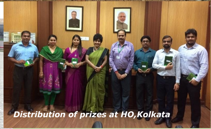
Distribution of prizes at HO, Kolkata

World Environment Day was celebrated with much fervour on 5 th June 2017 in units/establishments across locations. Various activities like sapling plantation, essay competition and online quiz contest were organised to create awareness on key environmental issues. Winners of the competitions were given away prizes. Saplings were planted in all the manufacturing units and establishments. In photo are glimpses of the celebrations pan India.