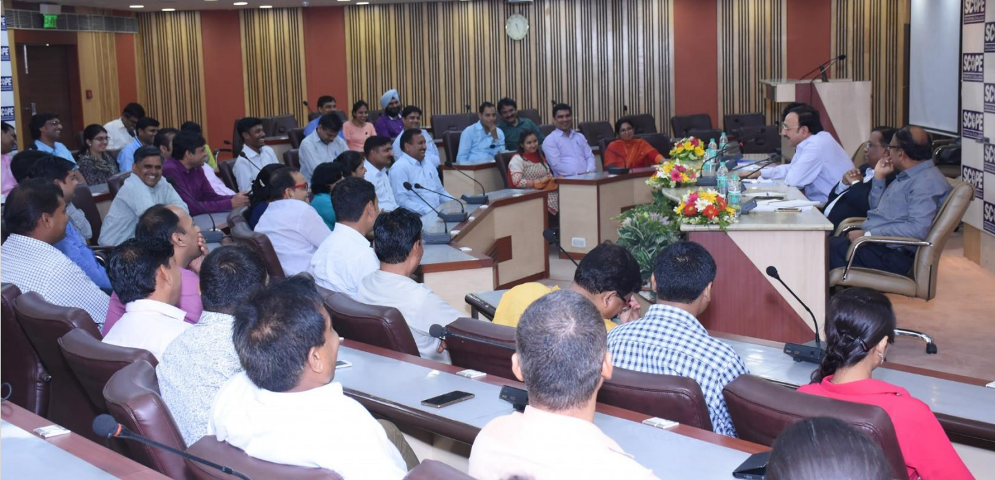
The Town Hall meeting for employees of the Northern Region was organized on 20 th June 2017 at the Scope Convention Centre, New Delhi. All the Officers and Executives were addressed by C&MD and Directors in two batches during the day. The participants were apprised about the Company's performance and feedback and suggestions were sought.